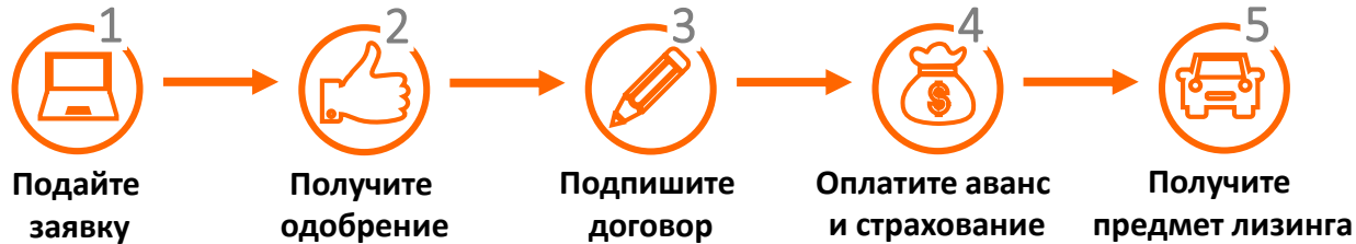
Схема оформления лизинговой сделки